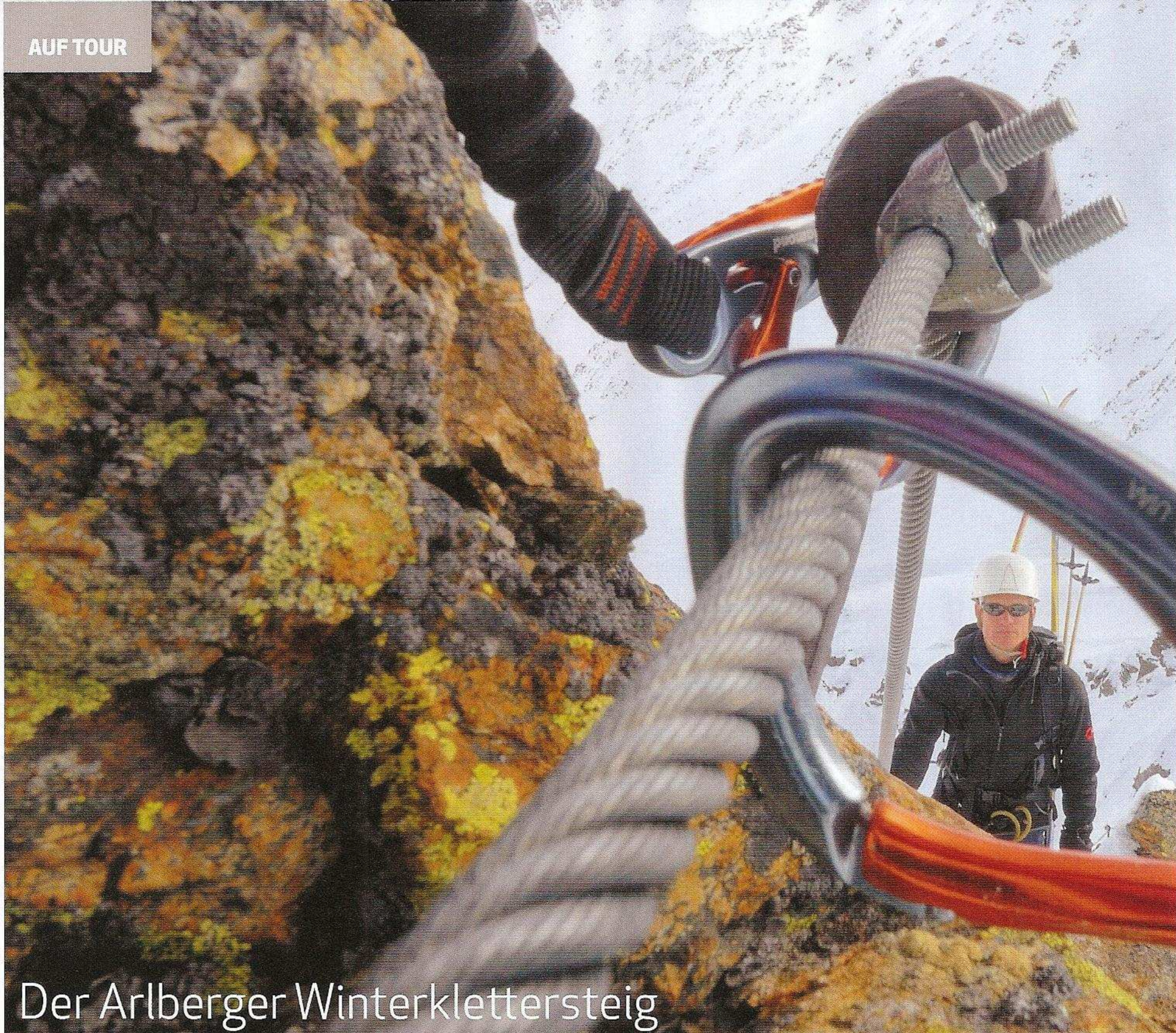
Der Arlberger Winterklettersteig