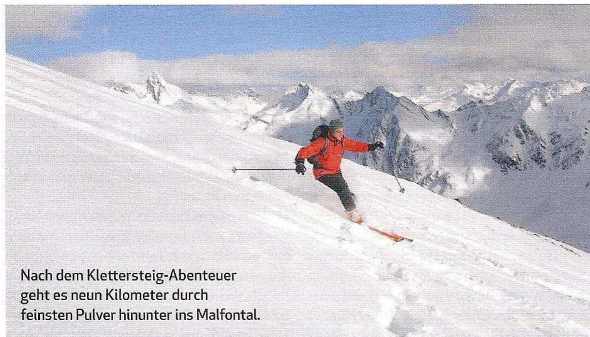
Nach dem Klettersteig-Abenteuer geht es neun Kilometer durch feinsten Pulver hinunter ins Malfontal.

Die Variantenabfahrt ist hier kein Selbstzweck, sondern Dreingabe nach der rund zweistündigen Kletterei. Neun Kilometer sind es hinaus nach Pettneu. Die Lawinenkegel, die sich bis in den Talgrund hinab schieben, erinnern daran, dass die Tour nur von erfahrenen Skibergsteigern angegan-gen werden sollte und wenn die Verhältnisse sicher sind. So schießen wir später den Forstweg hinaus und lösen bis zum Ende nicht die Frage: Ist der Arlberger Winterklettersteig nun eine Skitour mit Kletter-schmankerl oder umgekehrt? ◀