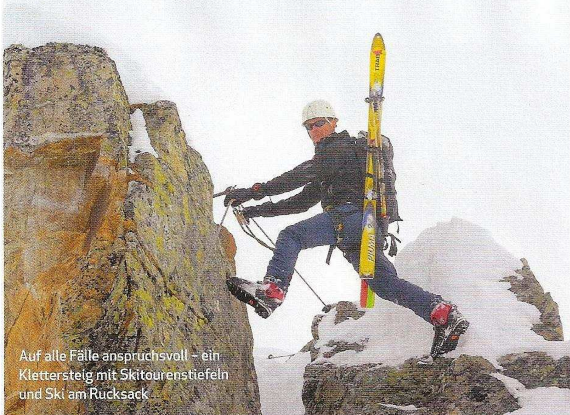
Auf alle Fälle anspruchsvoll – ein Klettersteig mit Skitourenstiefeln und Ski am Rucksack

Ungewisse? Wir folgen der alpinistischen Vernunft, bleiben am Drahtseil und verzichten auf die Freeride-Einlage. Später von unten werden wir erkennen, dass wohl nur Ortskundige die Durchfahrt durch den Felsriegel wagen sollten.